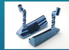
ゴルフのパターヘッド （伊福精密）