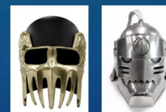
ジャギのヘルメット 鋼の錬金術師の鎧 （キャストム）