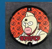
キン肉マン・ちびまる子ちゃん のマンホール（日之出水道機器）