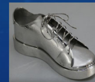
板金の靴 （晃新製作所）