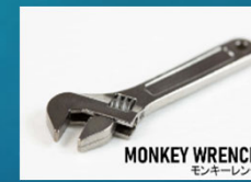
ミニチュア工具 （キャストム）