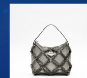
リベットを使用した鞆 （販売：モリトアパレル） （製造・組立：カネエム工業）